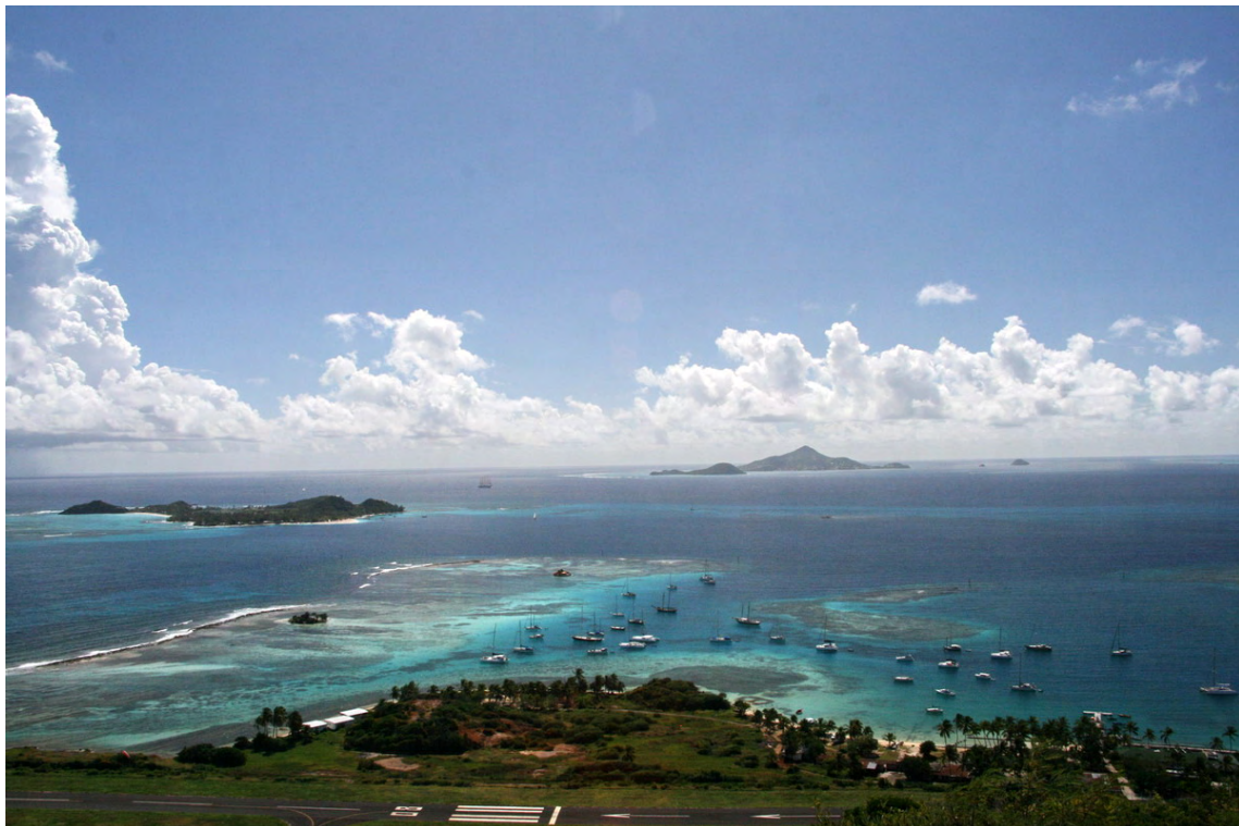
Vy över Clifton Bay och vår ankarplats på Union Island (vi ligger längst till vänster bland båtarna)