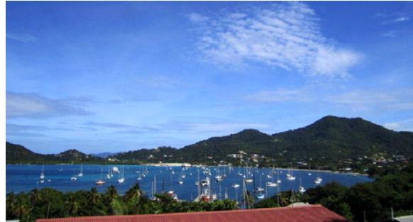
Tyrrel Bay, Carriacou

Även om vi var på en liten ö så fanns här segelmakare så nästa morgon lämnades vårt storsegel in för reparation och vi utforskade den lilla byn runt viken. Vi fick intryck av att här fanns många långliggare och redan nästa kväll var det stor premiär i viken på The Halleluiah Floating Bar, dvs en båt som byggts om till bar och dit vi seglare tog våra dingar. Vi också förstås, för att testa en rompunsch och umgås med massa engelsmän.