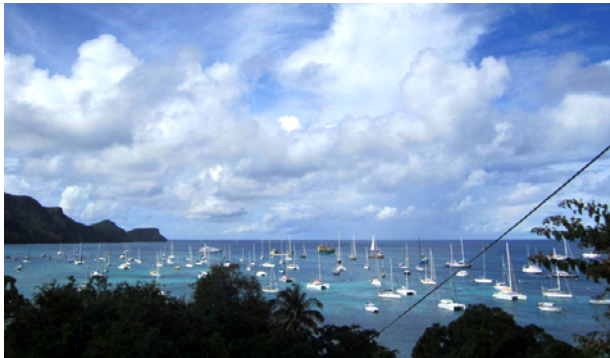
Admiralty Bay, Bequia