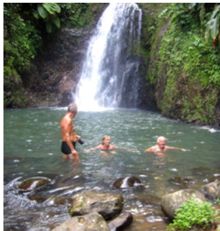
Svalkande bad i fallen