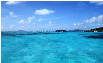
Vy från revet in mot ankarplatsen

Att snorkla ute på revet är som att simma i ett akvarium med alla sina färgglada fiskar. På väg tillbaka till båten hängde jag i en tamp efter dingens och fick sällskap av en rocka!