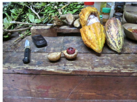
Muskot och kakao

Här plockade och torkade man muskot, kanel, lagerblad, nejlikor och kakao. Vi fick en intressant visning och kunde förstås handla lite men intrycket vi fick var att detta drevs i mycket liten skala och med urgamla metoder.