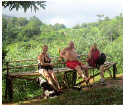
Trötta efter lång vandring