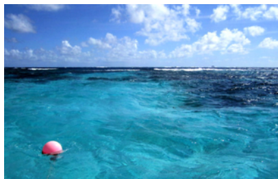
Boj att knyta fast dingens i