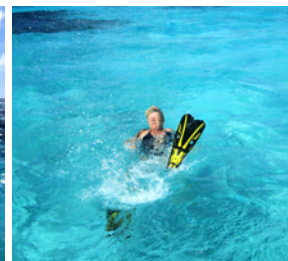
Nu ska det snorklas!

Det ska kosta 10 EC$ per dag och person att besöka området, något man gärna betalar för dessa fina upplevelser. Vi betalade första dagen men sedan var det ingen som brydde sig om oss. Från dag två låg vi dessutom på boj men ingen ville ha betalt för det heller. Killar från Union Island kör ut med båtar så man kan få skjuts in till någon av öarna och man kan köpa bröd, lobster, fisk och liknande förnödenheter.