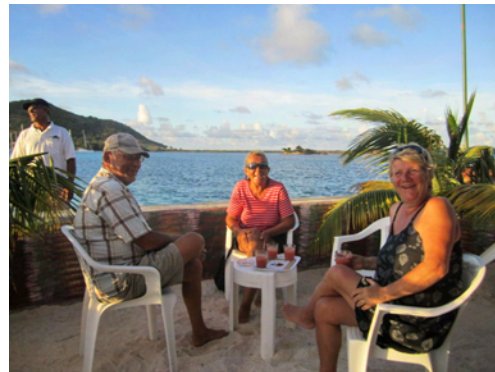
Där många tar en sundowner

Bakom Clifton finns Fort Hill, en 400 fot hög bergstopp, som vi klättrade upp på och belönades med härlig panoramautsikt över såväl vår ankarvik som större delen av Union Island och resten av Grenadinerna. Dessutom en makalös bild över naturreservatet Tobago Cays.