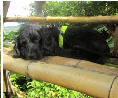
.. och Yester efter många intryck!

Tillbakavägen var förstås lika lång så vår idé om att gå runt Grand Etang Lake frös inne. Vi körde ner till sjön, som är vulkanisk och kikade. Det lustiga med denna sjö är att här bubblar det när vulkanen "Kick em Jenny", som ligger under vattnet norr om Grenada, är aktiv. Till slut hamnade vi vid Grand Etang Forest Center, trötta och hungriga.