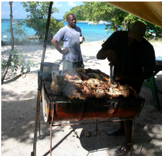
Det ordnas barbeque på stranden

Det ska kosta 10 EC$ per dag och person att besöka området, något man gärna betalar för dessa fina upplevelser. Vi betalade första dagen men sedan var det ingen som brydde sig om oss. Från dag två låg vi dessutom på boj men ingen ville ha betalt för det heller. Killar från Union Island kör ut med båtar så man kan få skjuts in till någon av öarna och man kan köpa bröd, lobster, fisk och liknande förnödenheter.