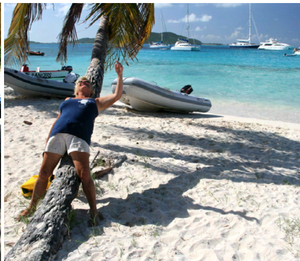
Palmer, vita stränder & turkost vatten - ljuvligt!